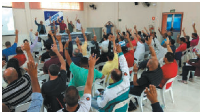
Líderes sindicais durante a aprovação da pré-pauta de reivindicações